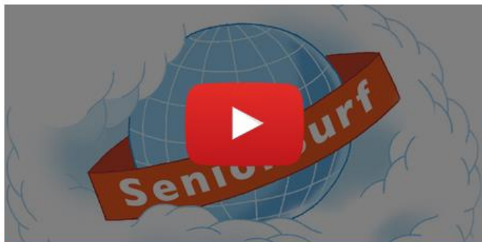
Mikä on SeniorSurf?